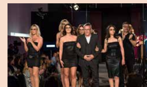
2016 Modeschau bei Garage Schilling