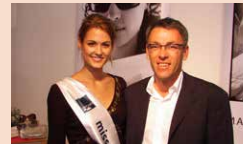
2005 Gewa mit Miss Schweiz