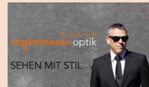
2011 Piavera Werbung Man in Black