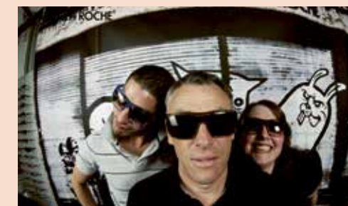
2009 Team Piavera