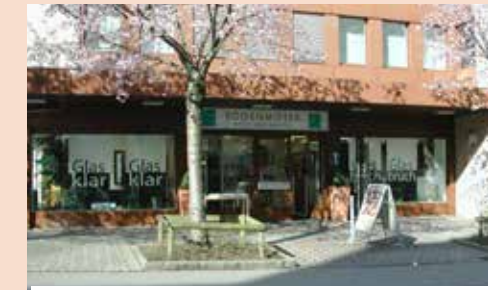
1999–2011 Unser 2. Geschäftslokal