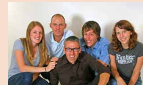
2007 Meine Kids