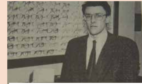
1986 Das Eröffnungsinserat

Was für eine spannende und wundervolle Zeit, mit so vielen Menschen die uns berührt haben und ohne die ich dieses grossartige Jubiläum nicht feiern könnte. Meine wunderbaren Mitarbeiter! VIELEN DANK!